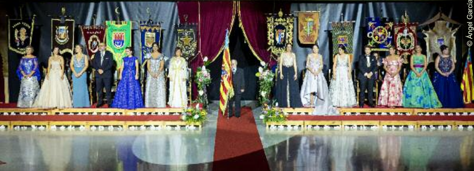
Los cargos festeros en el momento más emocionante de la noche, cuando todos juntos cantan el Himno a València