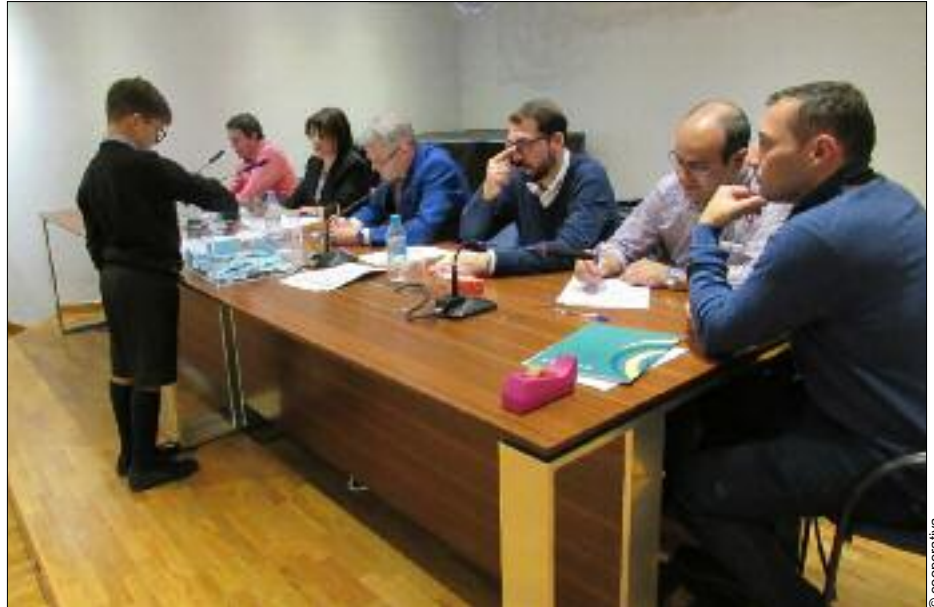
Sorteo ante notario de las becas del pasado año

Los interesados en participar en este proceso deben cumplimentar la solicitud y entregarla, junto a la documentación requerida, en las oficinas de la Cooperativa Eléctrica como máximo hasta el viernes 25 de octubre a las 14 horas. Durante el mes noviembre se realizará tanto la asignación directa de las ayudas económicas como el sorteo, según proceda, y los resultados se darán a conocer mediante una lista expuesta en la sede de la entidad de la calle