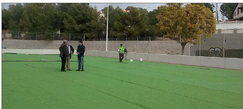
Visita a las obras de reforma de uno de los campos de césped artificial municipales

Por un valor de 503.948,44 euros; es decir, un 16,79% menos del total del presupuesto de licitación que ascendía a