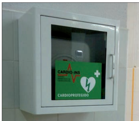
Uno de los desfibriladores instalados

En España se producen 30.000 paradas cardíacas anualmente, y solo el 5% de los centros educativos disponen de desfibrilador en sus instalaciones, cifra muy inferior a la de otros países de Europa donde este se sitúa en términos de hasta el 40%.