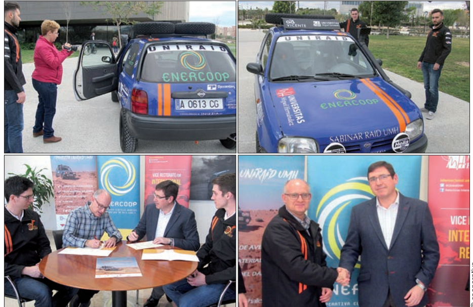
Arriba, presentación de los vehículos participantes. Abajo, dos momentos de la firma del convenio