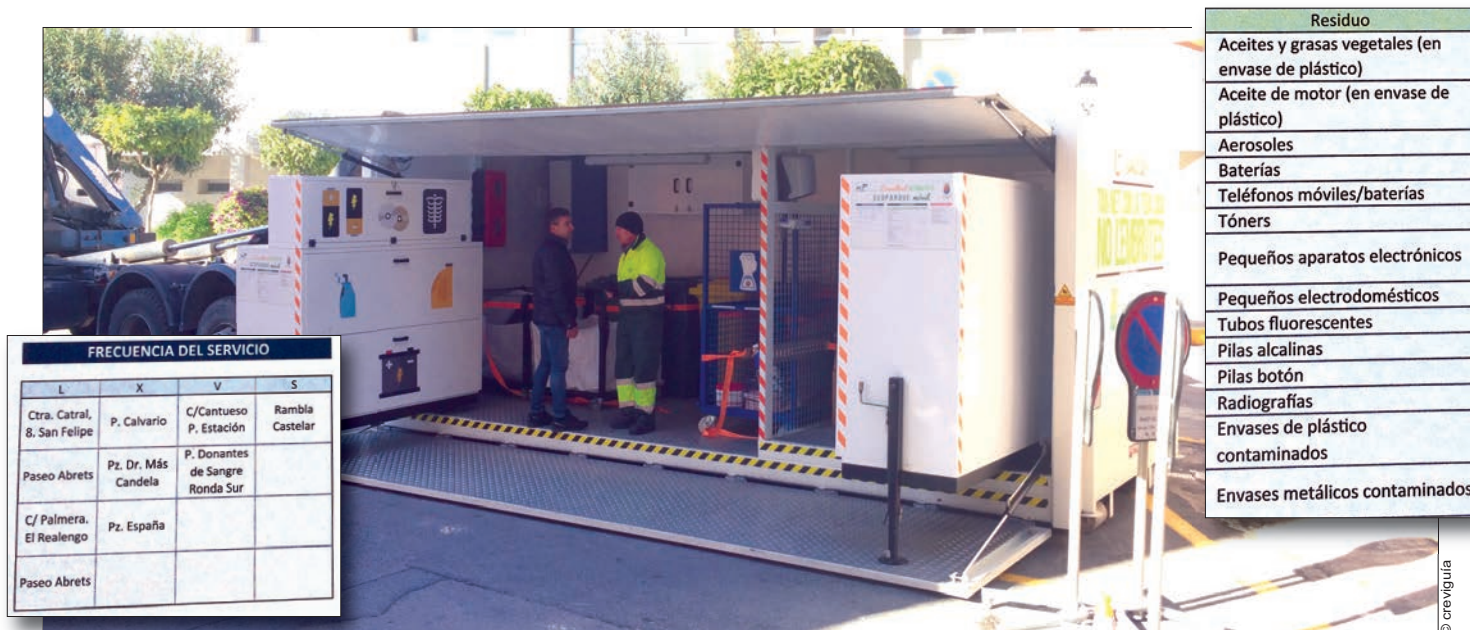
Ecoparque móvil situado en el Salitre. A la izquierda, días de ubicación y a la derecha, tipos de residuos que se admiten.