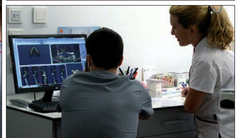
El equipo de Rayos X Digitales, Panorámicos e Intraorales, sala de espera y diagnóstico en un box

pacientes un servicio sanitario de calidad en diferentes facetas dentro de esta especialidad médica basada en la salud bucodental; desde la odontología conservadora a la ortodoncia, pasando por la odontopediatría, la medicina y cirugía oral, la estética dental, prótesis, implantología y los tratamientos con láser o la periodoncia.