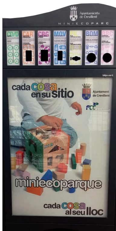
Ecoparque de reducido tamaño

Este ecoparque móvil acerca la posibilidad de reciclar a los ciudadanos, se la pone al lado de casa, como lo hacen los ecoparques de reducidas dimensiones. La Concejalía de Servicios, junto a FCC; ha instalado mini-ecoparques para el reciclado en zonas del casco urbano de Crevillent, así como en las peda-