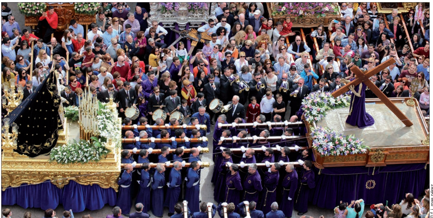
Tercero de los encuentros entre la Dolorosa y el Nazareno (ambos de Benlliure), que se producen en Crevillent y que se conocen con el nombre de Abrazo

Per finalitzar este xicotet recull, m'agradaria animar-vos a col·laborar en esta bella labor de conservar el nostre patrimoni oral, com ja ho fan un grup molt nombrós d'amables crevillentins als quals done des d'ací les gràcies de tot cor per fer-ho. Si esteu disposats i teniu Facebook, únicament heu de demanar una sol·licitud per apuntar-vos al grup "Expressions, dits i paraules crevillentines" i passareu un bon "ratet" i contribuïreu a deixar un legat cultural i patrimonial molt important a les generacions futures. Una abraçada a tots i totes i molt felix primavera.