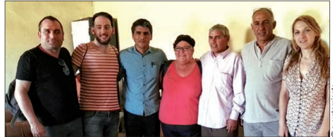
Reuniones mantenidas por los ediles con autoridades saharauis

que hay en las escuelas y en los Campamentos, son mujeres y que además son mujeres preparadas que poseen titulación oficial para realizar y dirigir este tipo de actividades deportivas.