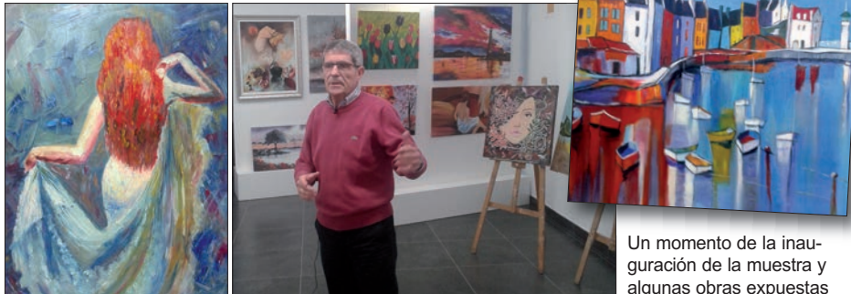
Un momento de la inauguración de la muestra y algunas obras expuestas