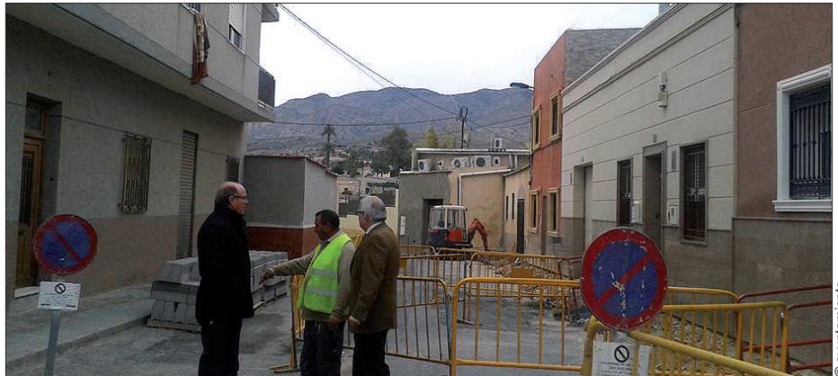
Visita a las obras de la calle Ramiro de Maetzu

En la avenida San Vicente Ferrer, se asfaltarán 300 m 2 para mejorar las condiciones de la calzada y se sustituirá parte de la con-