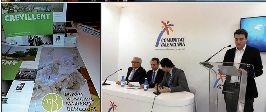
Arriba, dos momentos del desfile festero por el centro de Madrid. Abajo, folletos y rueda de prensa