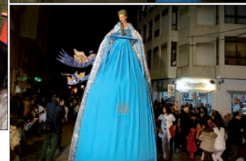
Varios momentos de la San Silvestre Crevillentina y de la Cabalgata de los Reyes Magos de Oriente

Sofás | Dormitorios | Salones | Mueble juvenil | Auxiliar | Descanso