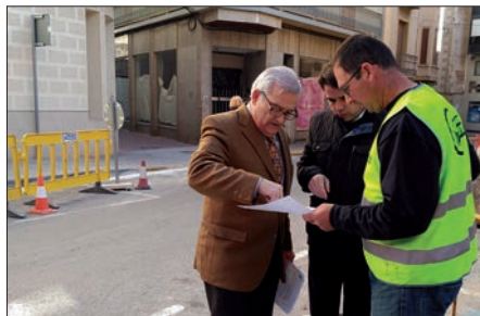
Visita a las obras del alcalde y el edil de Obras

El Consistorio inició las obras de acondicionamiento y mejora en la calle Carmen y han continuado en la calle Blasco Ibáñez, donde se ha sustituido la red existente de agua potable y se han ampliado los anchos de las aceras, adaptándolas a la normativa actual. Se asfaltarán la calle en una superficie de 1.350 m 2 y posteriormente se procederá al marcado del vial. Además se plantarán 2