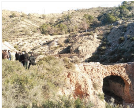
Zona donde se están realizando los trabajos

Mediante un convenio suscrito entre el Ayuntamiento y la Diputación de 28 de marzo de 2015, el Consistorio se hacía cargo de los gastos de contratación de la