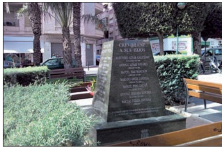
El monumento en honor a las víctimas

También por acuerdo de todos los representantes municipales, se acordó que fuera