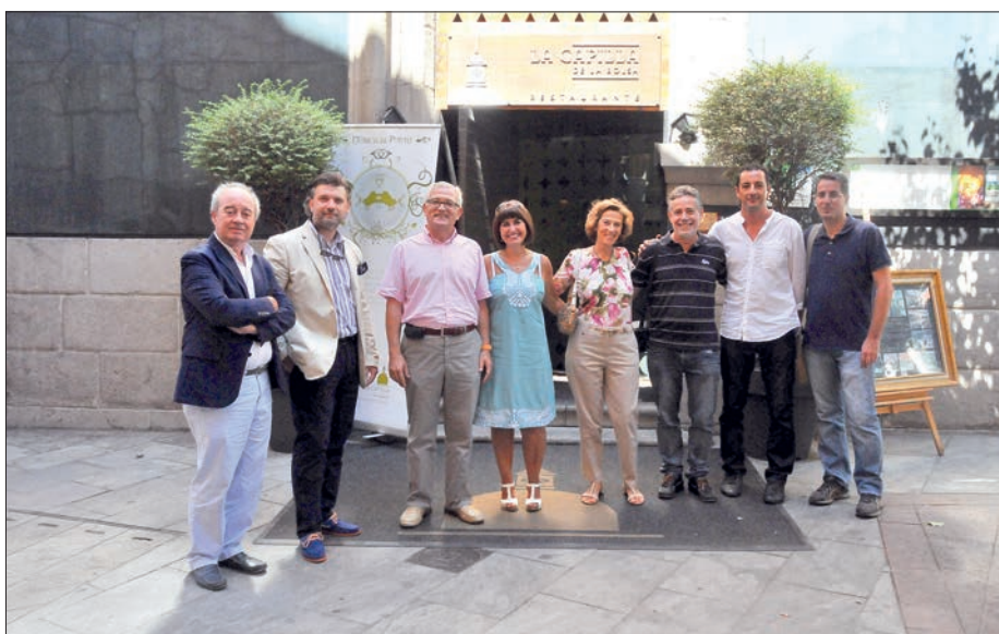
Miembros del jurado del premio y, entre ellos, el alcalde de Crevillent