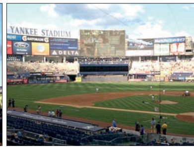
Arriba, Alejandro en el estadio de los Yankees, que aparece en el resto de imágenes desde distintos puntos de vista