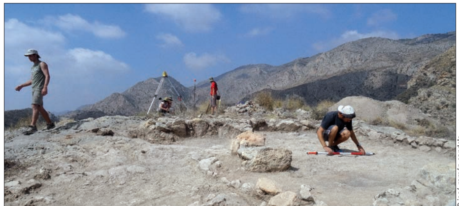
Trabajos en el yacimiento arqueológico de la Peña Negra de Crevillent