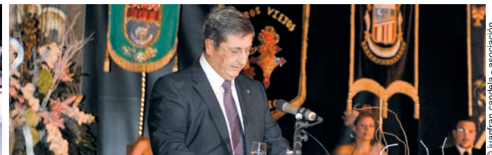
Cargos en el apoteosis final del Acto de Proclamación y varios momentos del evento, el pasacalles y el mantenedor, el rector de la UMH