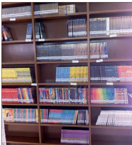
Estantería con los CD y DVD de la Biblioteca