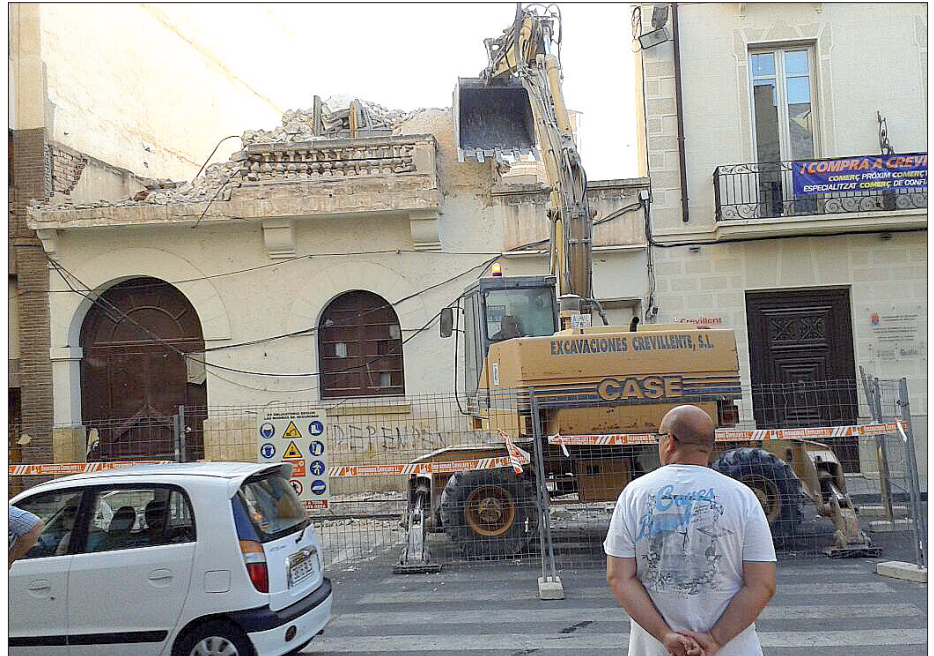
Un momento de los trabajos de derribo de uno de los emblemas del centro del municipio

No ha habido coherencia en esta materia. ¿Por qué los particulares no pueden hacer lo mismo que ha ocurrido con el Teatro Chapí? Derribar y esperar a tiempos mejores para volver a edificar. Otro mal ejemplo: ¿Se le hubiera permitido a un particular abandonar un edificio emblemático, construido en 1885, hasta que se fuera cayendo a pedazos? Pues esto mismo está ocurriendo con el antiguo Hospital, propiedad del Municipio, increíble pero cierto. Desde que dejó de prestar servicios hace más de cuarenta años su desamparo ha sido total, el vandalismo se adueñó del inmueble, cuyo patio central a modo de claustro, con su aljibe en medio, daba gusto contemplar. Es cierto que el inmueble está en ruinas; así lo dictamina un infor-