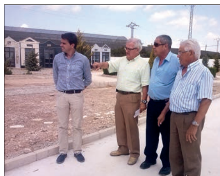
Visita a la zona donde se realizarán los trabajos

La subvención concedida por la Diputación Provincial cubrirá el 56% del coste de la obra, 78.000 € y la aportación que hará el Ayuntamiento de 60.000 € el