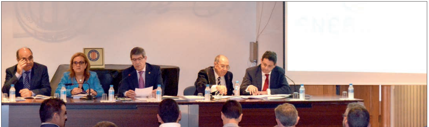
Última asamblea general ordinaria de la Cooperativa Eléctrica San Francisco de Asís