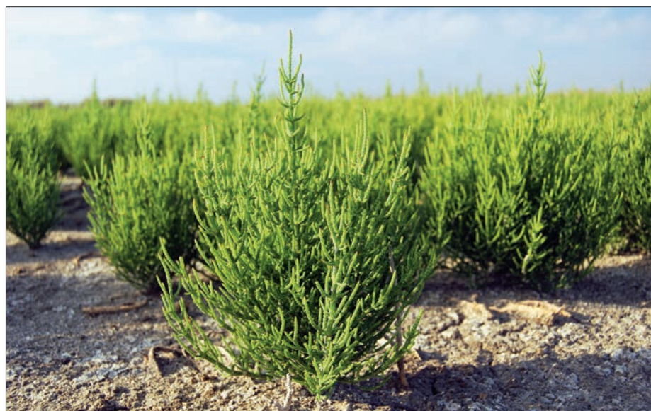
Variedad de salicornia que se comercializa con el nombre de “ espárrago de mar ” fotografiada en el Parque Natural El Hondo

das de baja calidad o aguas salada para la agricultura parece de locos, pero hay quien ya lo está haciendo. Un país como Holanda, con la mitad de horas de sol que España, ha conseguido hacer rentable su cultivo en invernaderos donde se hace necesario emplear luz artificial para acelerar su crecimiento. Desde allí se exporta a toda Europa, a un precio