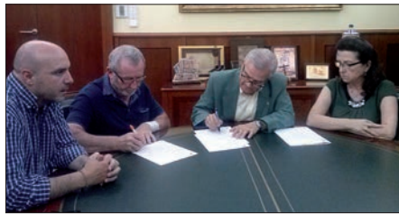
Un momento de la firma del convenio

El Ayuntamiento se compromete a proporcionar la dotación económica y la Sociedad Unión Musical a programar junto a la Concejalía de Cultura una serie de actuaciones musicales en las que participen instrumentos de cuerda.