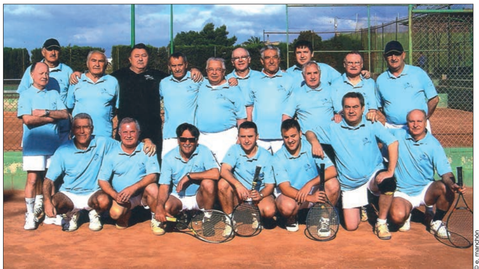
Participantes en el XXX Torneo Perola, celebrado en 2010 en el Club de Tenis de Crevillent

No pretende ser este artículo la crónica –amplia y plural- de la Asociación Club de Tenis Crevillente, a la que deseo la mejor vida y la más extensa trayectoria. Me conformo con que, éste, sea el relato de una de las muchas historias posibles en el discurrir del estupendo pueblo en el que hemos nacido y en el que desarrollamos nuestra existencia. Me conformaría con que fuese un pequeño homenaje a todos aquellos que, a lo largo de sus 32 años de existencia, participaron en este, hoy extinto, torneo Perola.