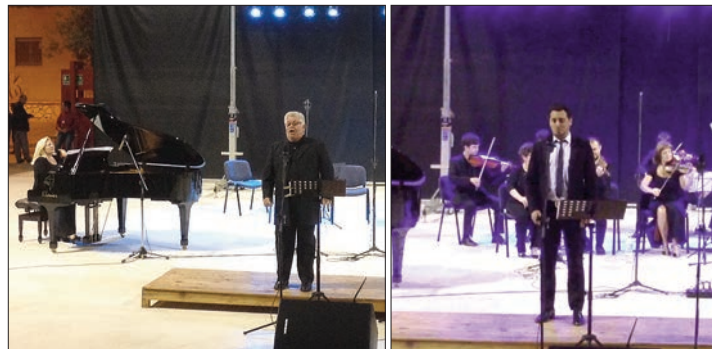
Distintos momentos de la actuación de "The tenors" en la Casa de Cultura