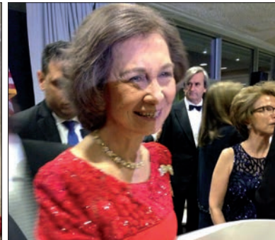
Arriba, el colaborador de El Periódico del Poble junto a la reina Sofía y el edificio de la ONU. Abajo, un momento del acto y primer plano de Su Majestad cuando era saludado por Joaquín.