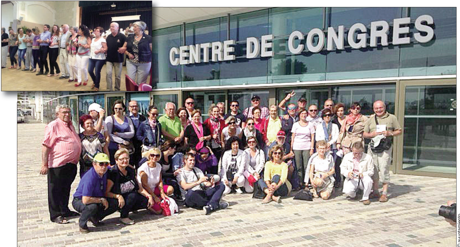
Participantes en el viaje de hermanamiento realizado a principios de junio por una delegación crevillentina a Fontenay Le Comte