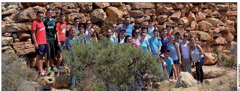
Los alumnos participantes en la excursión arqueológica en El Castellar

El área de arqueología del Ayuntamiento de Crevillent, dependiente de la Concejalía de Cultura y el Instituto Canónico Manchón ha organizado una actividad conjunta dirigida al alumnado de primero de bachillerato de Humanidades y Ciencias Sociales para que los alumnos conozcan de primera mano los yacimientos arqueológicos como Peña Negra o El Castellar y la importancia del patrimonio arqueológico de Crevillent. Según la concejal de Cultura, Loreto Mallol, esta actividad didáctica se ha dividido en dos partes. Una primera ha sido la realización de una conferencia, que se impartió en el Instituto, sobre el patrimonio arqueológico de Crevillent desde el Paleolítico Superior hasta la Edad Moderna con las excavaciones del