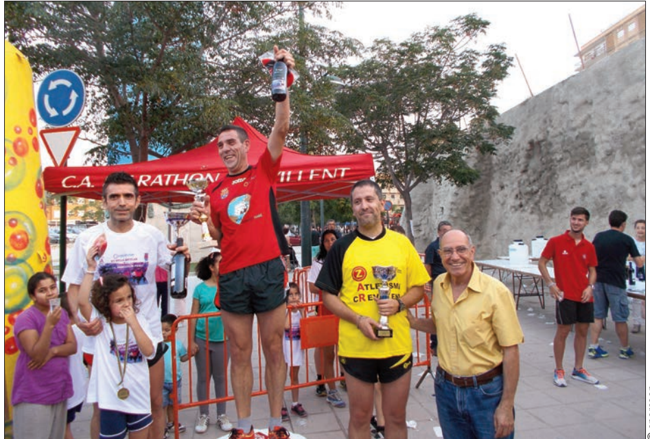
Varios momentos de las pruebas deportivas organizadas el pasado 7 de junio y que contaron con la colaboración de la Cooperativa Eléctrica