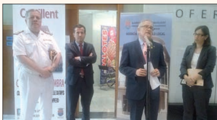
Inauguración de la Feria de Formación y Empleo

Crevillent acogió a finales de mayo la Feria de Formación y Empleo Creviempleo 2014, que organiza la Concejalía de Fomento Económico, Formación y Comercio. La Feria se celebró durante dos días en la planta baja de la Casa Municipal de Cultura "José Candela Lledó". Fueron 40 las entidades que expusieron, más 6 las empresas instaladas en Crevillent que ofrecieron la posibilidad de admitir las demandas de los desempleados de Crevillent, e informar directamente de los sistemas de acceso informático a dichas empresas, de inscribirse en las bolsas de trabajo y de cómo tener información de las ofer-