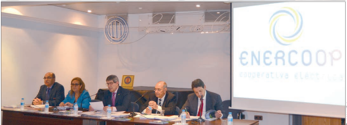
Dos momentos de la asamblea general ordinaria de la Cooperativa Eléctrica San Francisco de Asís, celebrada el pasado 13 de junio

E l pasado viernes 13 de junio, se celebró en el Salón de Actos de Cooperativa Eléctrica San Francisco