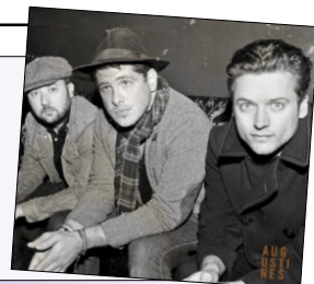
GRUPO: AUGUSTINES DISCO: AUGUSTINES AÑO: 2014

de los diferentes "palos" que le ha pegado la vida a Billy su principal compositor. Que te enganchan desde la primera escucha, no sé si os he comentado alguna vez lo amante que soy de las canciones con tintes épicos y ahora que Arcade Fire se han pasado a la pista de baile he de ir buscando bandas más undergrounds que remuevan entrañas como lo hacían los canadienses en sus primeros trabajos. El disco al igual que sus temas está estructurado en crescendo, tras una breve introducción, en el corte tres encontramos ese maravilloso single de adelanto que fue el preludio de este larga duración "Nothing To Lose But Your Head" según avanzamos hallamos una pareja ganadora formada por "Don't You Look Back" y "Walkabout" y el punto culminante lo pone "This Ain't Me", la mejor y más dinámica de la docena, luego el disco se toma un respiro para terminar de una forma magistral con otra soberbia melodía el "Hold Onto Anything" un digno final para un disco sobresaliente. Sería una muy buena noticia poder encontrarlos a la banda en algún festival veraniego para comprobar si son tan buenos en directo como dentro del estudio, sería la bomba.