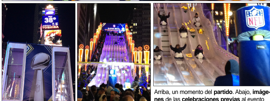
Arriba, un momento del partido. Abajo, imágenes de las celebraciones previas al evento