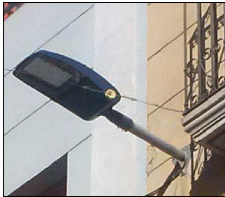
Nuevo alumbrado público

con una potencia lumínica mayor y consumen la mitad que las de sodio. Igualmente desprenden un color blanco de luz, a diferencia de las de sodio que son un color amarillo, lo que favorece que haya una sensación de mayor seguridad en la vía pública.