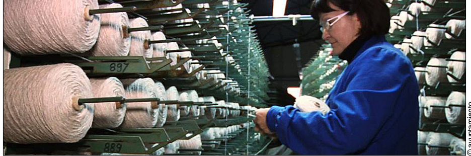
Fotograma del reportaje que se emitió en TVE en el programa "Fabricando Made in Spain"

Televisión Española en su primera cadena y dentro del espacio "Fabricando: Made In Spain", emitió el pasado 3 de febrero un reportaje dedicado a la fabricación de Alfombras y Moquetas, el cual fue filmado los pasados 18 y 19 de diciembre en empresas de nuestra localidad. Desde la Concejalía de Fomento, se solicitó la colaboración estrecha de UNIFAM, la cual se prestó durante los días previos y de filmación, seleccionando firmas, ubicaciones, autorizaciones y coordinando el cronograma de actuación. Finalmente, las cuatro empresas que participaron en el proyecto y cuyas imágenes aparecen en el reportaje son: Hilaturas Textiles Crevillentinas SAL, Tapisa, Antonio Pérez Adsuar SA y Grupo Universal. El reportaje ofreció un completo documental