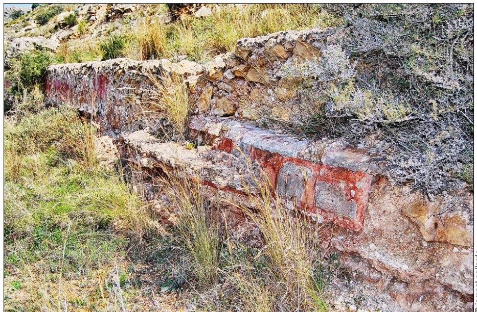
A lo largo de la Rambla del Castellar se disponen diversas canalizaciones que provienen de la Fuente Antigua , siendo posible encontrar puntos donde se superponen acequias de hasta tres épocas diferentes

Actualmente todavía se sigue extrayendo un volumen anual cercano a los 10Hm 3 a través de los pozos situados en Aspe, los Hondones o Albaterra, siendo una parte muy