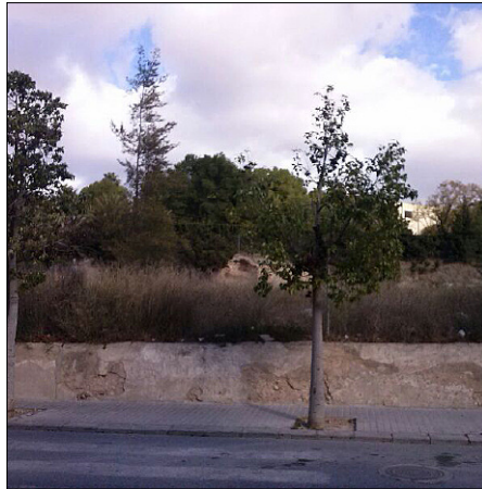
Solar de Bonastre en calle Crevillentinos Ausentes

A partir de 1995 se procedió a negociar con los propietarios de la parcela consiguiendo que renunciaran a la indemnización a cambio de ceder gratuitamente 2.763 m 2 del solar para destinarlo a zona verde. A