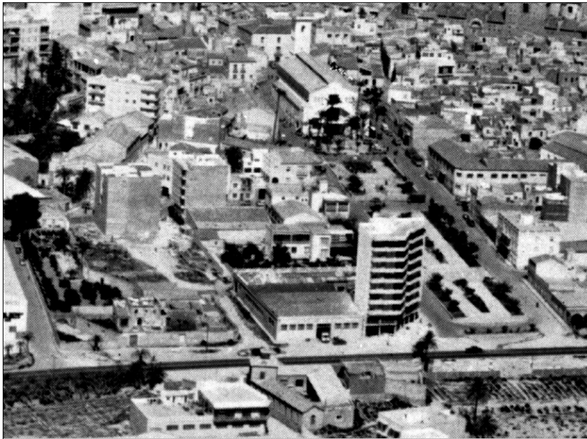
Detall de la foto aèria d'autor anònim (publicada en: Revista Moros y Cristianos, 1973; s/p.) on s'aprecia, en primer terme, "La Casa de les Persianes", ubicada al solar hui comprés entre la Avda. Sant Vicent Ferrer i el C/ Óscar Esplà. Enfront es situaven els batans del segle XIX, prop de La Creu de Ruissa i "La Rambla" - a l'esquerra de la imatge-

En els pavellons destinats a exposicions nacionals i universals, eren habituals els accessos monumentals i les naus laterals amb arcs repetits de tipologia islàmica, prenent com un dels referents d'inspiració l'arquitectura califal cordovesa; a més que, freqüentment, anaven associats a paisatges enjardinats. Per altra