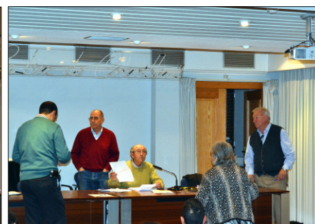
Distintos instantes del acto de entrega de becas que se celebró en los salones de la Cooperativa