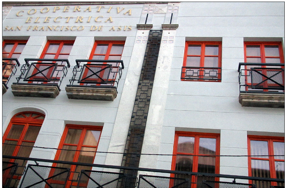
Sede de la Cooperativa Eléctrica Benéfica San Francisco de Asís, fundada en 1925

Ochenta y nueve años después la generosidad de sus fundadores continua dando frutos cada vez mejores y los crevillentinos se sienten más orgullosos de su “Cooperativa de la Llum”. Todos conocen sus aportaciones de carácter social, tantas y tan diversas que resulta difícil detallar. Pero sobre todo, las tres obras sociales propias: Museo Julio Quesada, Tanatorio Virgen del Rosario y Residencia de Ancianos la Purísima, pregonan la categoría de la entidad. Sigue Cooperativa cumpliendo la máxima evangélica: “Por sus obras los conoceréis”.