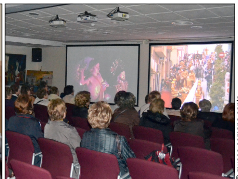
Visitantes en una de las plantas y viendo el vídeo de la Semana Santa. A la izquierda, preparando una exposición

infantiles que ayudan a divulgar la Semana Santa entre los más jóvenes.