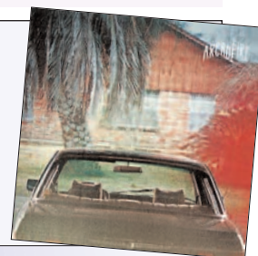
ARCADE FIRE "THE SUBURBS (2010)" SELLO: MERGE-MERCURY/UNIVERSAL

añaden un cierto sabor añejo con composiciones cercanas al rock ochentero. Puede que todos tengan razón, pero se necesitan varias escuchas para sacar conclusiones y por tanto no quiero todavía pronunciarme si estoy de un lado o de otro. Además creo que se les puede perdonar todo al saborear el corte número 15. Me refiero a la maravillosa Sprawl II (mountains beyond mountains) un "melocotonazo" tecno-pop en donde Régine Chassagne se pasa a la pista de baile haciendo de La Roux o de la mismísima Róisín Murphy, un tema que ya se ha convertido en todo un clásico en mi maleta de dj. Creo que al final de año estará en todas las listas como unas de las canciones del 2010. Dejemos por tanto que el tiempo nos diga si estamos ante una obra maestra de un gran grupo o si por el contrario ante otro hype que tras el asombro inicial se va diluyendo hasta ser devorado por la industria. No sería la primera vez que ocurre.