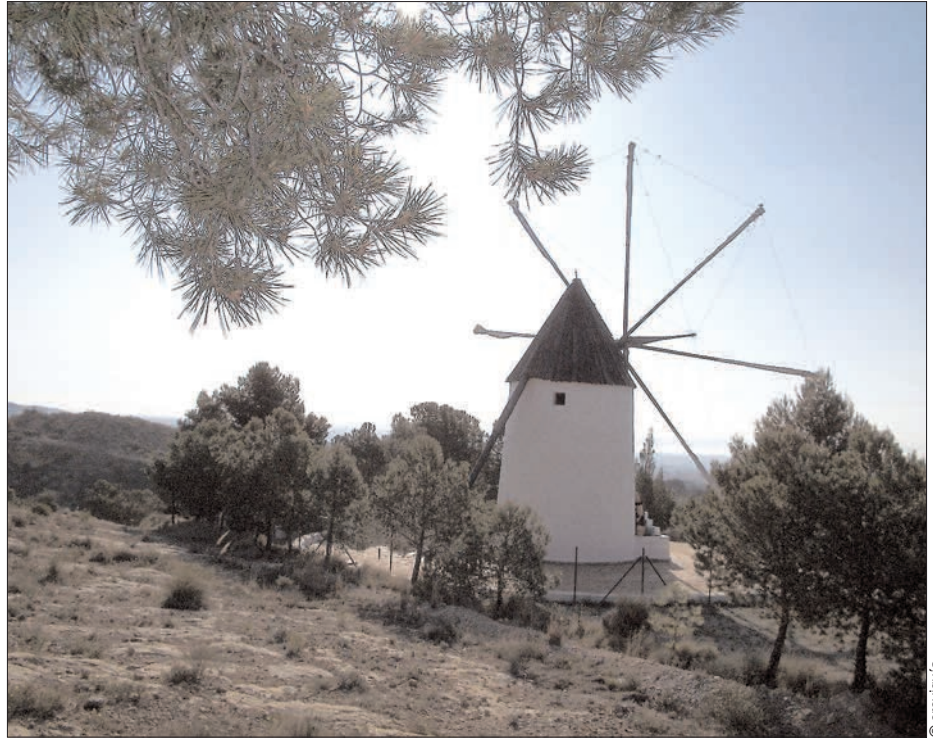
Imagen característica del centro de educación medioambiental Los Molinos

El 5 de Junio de 1979, Día Mundial del Medio Ambiente, el centro se presentó ante los Ministerios de Industria y Educación