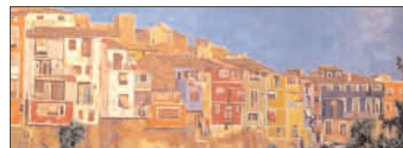
Una de las obras que se puede ver en Cooperativa

La obra de Martínez se encuentra actualmente repartida en colecciones públicas y privadas de todo el mundo. Algunas de sus creaciones se