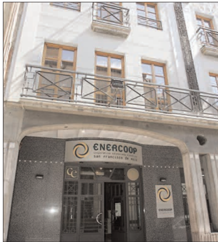
Fachada de la Cooperativa Eléctrica

logró un ahorro económico para sus socios de 987.000 euros, cifra que se incrementó hasta superar el millón de euros en 2004. Desde entonces, esta tendencia positiva se ha mantenido hasta registrar en 2009 un nuevo record de cifras, superando los 1.495.000 euros que se obtuvieron