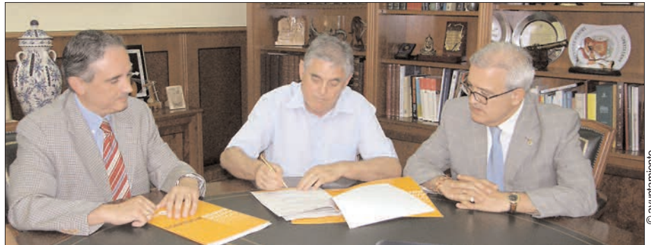
Los responsables de Cooperativa y Caja Mediterráneo firmaron sus acuerdos junto al alcalde

La representante de la Conferencia San Vicente de Paúl agradecía la firma de estos