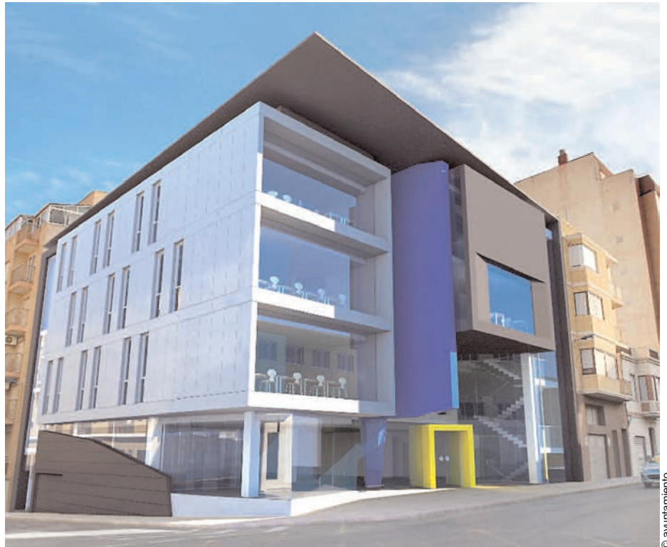
Imagen incluida en el proyecto de construcción del nuevo centro juvenil, con entrada por avenida de Madrid

El inicio de las obras está previsto para los próximos días y la empresa tiene un plazo de ejecución de 10 meses