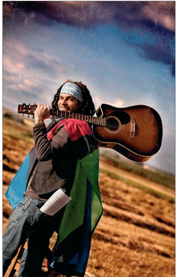
El Arrebato llenará de alegría la Barraca Popular con sus canciones

En estos nueve años, El Arrebato ha lanzado canciones como Duele, Ojú lo que la quiero, Hoy me dio por ser honesto, Poquito a poco, Ve despacito, Háblame del sur, A mí na' ma', Búscate un hombre que te quiera, Por un beso de tu boca, Un amor tan grande, Una noche con arte, No puedo más, Dame cariño, Hoy todo va a salirme bien, Mirando pa ti... Son temas que se han incrustado en la memoria popular a los que ahora se unen los de su nuevo álbum Lo que el viento me dejó que se publica el 7 de septiembre. "Os agradezco de corazón que estéis siempre ahí, que hagáis que este loco majara que habla con el viento no sea un loco majara que habla con el viento solo, sino que está acompañado de muchísima gente que refuerza todo lo que hago", dice El Arrebato en su web agrade-