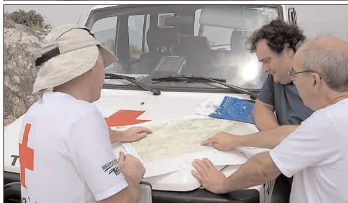
Arriba, miembros de Protección Civil este verano en el punto de vigilancia en lo alto de La Vella. Abajo, voluntarios del grupo de montaña de Cruz Roja en el voluntariado

medio de una senda y así evitar que alguien la pise; cuando observamos que algún particular se ha entretenido en podar las ramas bajas de algún pino o retirarle alguna "bolsa" de procesionaria; o cuando alguien se esfuerza en poner obstáculos para que el senderista no se salga del camino marcado.