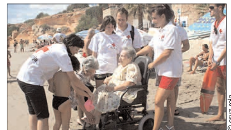
Voluntarios asistiendo a una mujer en la playa