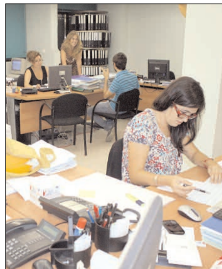
La empresa de asesoramiento a empresas y particulares Trade Asesores cuenta con un equipo humano de profesionales que trabajan para ofrecer el mejor servicio al empresario y al particular

Además, estos trabajadores actualizan cada año sus conocimientos a través de másteres, cursos y seminarios profesionales.