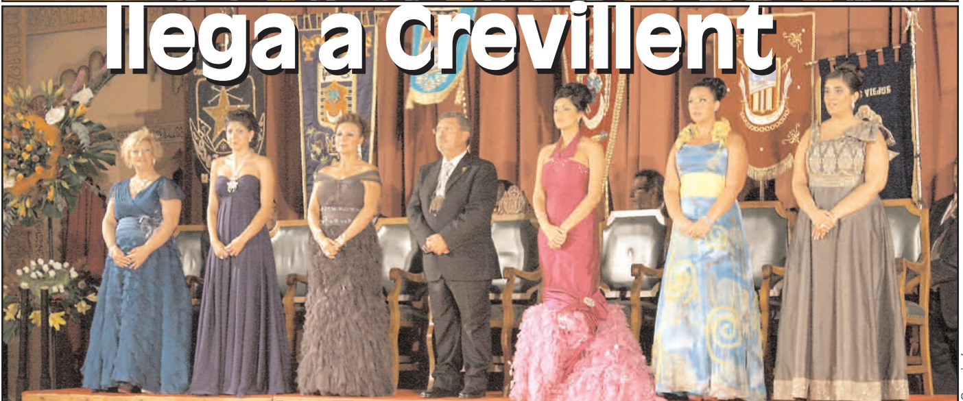
La proclamación de Capitanes y Bellezas abre oficialmente las Fiestas Patronales y de Moros y Cristianos de Crevillent. Páginas 9 a 12