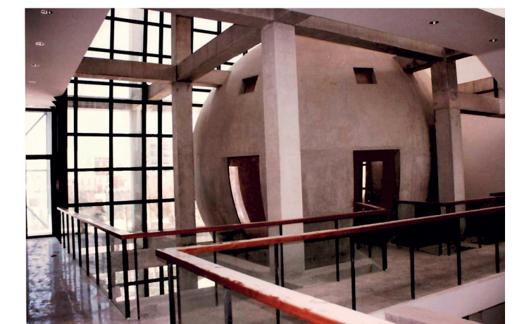
AMCR, Proceso de construcción de la Casa Municipal de Cultura, 1996, Sig. 5869/1.