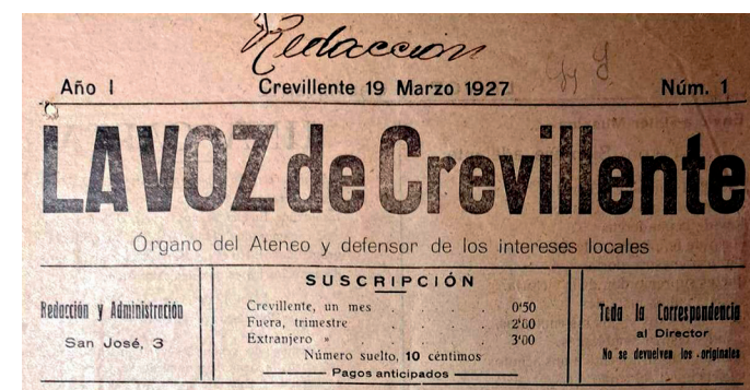
AMCR, Hemeroteca, La Voz de Crevillente, 1927.

Esta magna obra, tras muchos retrasos y problemas de cimentación y financiación, fue finalmente inaugurada el 13 de septiembre de 1997, con la presencia del Presidente de la Diputación Provincial de Alicante, acto que contó con la actuación de los coros crevillentinos, acompañados por la banda de música.