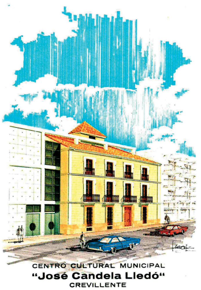
AMCR, Postales de la Casa Municipal de Cultura, s.f. Sig. 8478/4.