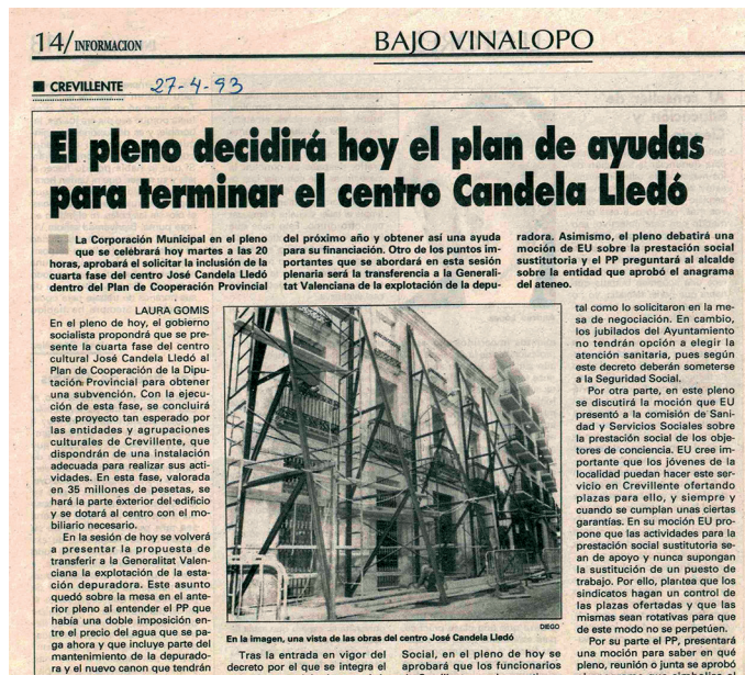
AMCR, Recorte de prensa, 1993, Sig. 8478/4.