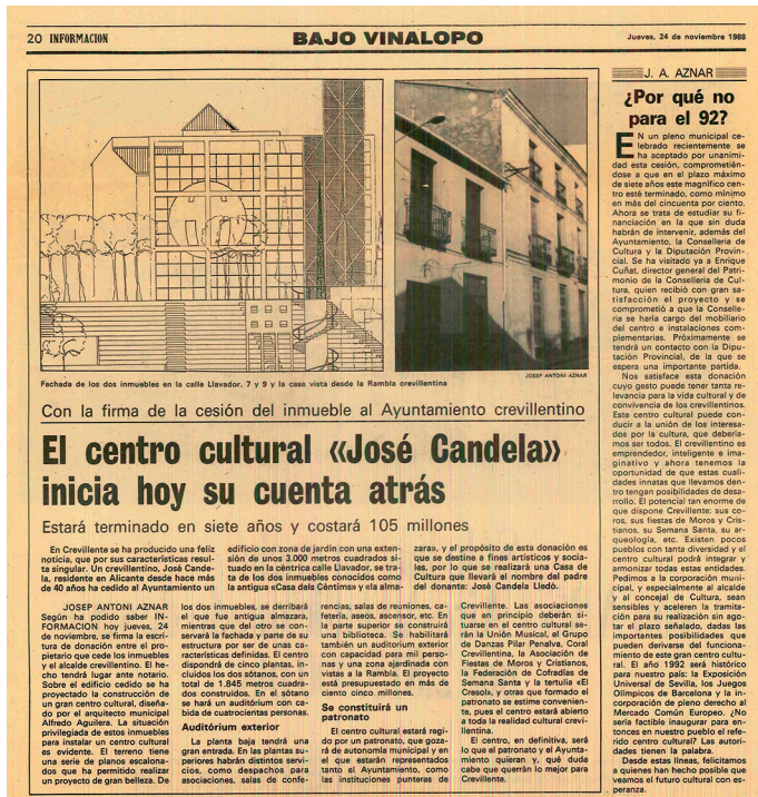
AMCR, Recortes de prensa, 1988, Sig. 8478/4.

quilados o cedidos por el Ayuntamiento que, en 1959, comenzó a pesar la idea de construir un edificio destinado a Casa de Cultura Municipal, en aquel momento proyectado en el edificio situado en la Plaza de la Constitución, número 11 (actual Casa Festero).